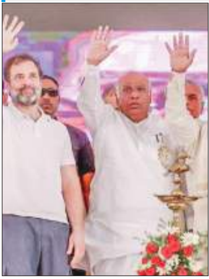
कर्नाटक विधानसभा चुनाव से 24 दिन पहले कांग्रेस नेता राहुल गांधी ने कोलार में जनसभा को संबोधित किया।