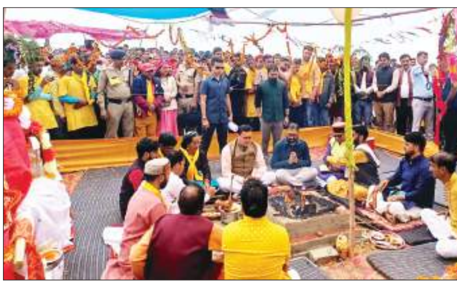
उत्तराखंड के मुख्यमंत्री पुष्कर सिंह धामी रविवार को नागदेवता मंदिर में मूर्ति प्राण प्रतिष्ठा कार्यक्रम और स्थानीय मेले में पूजा-अर्चना कर प्रतिभाग किया।

टीएम एक्शन इंडिया/नई दिल्ली देश में आर्थिक गतिविधियों में सुधार के चलते बढ़ी मांग से वित्त वर्ष 2022-23 में बिजली की खपत में 9.5 प्रतिशत की वृद्धि रही है। पिछले वित्त वर्ष में कुल 1,503.65 अरब डालर बिजली की खपत रही है। केंद्रीय विद्युत प्राधिकरण (सीईए) के डाटा के अनुसार, वित्त वर्ष 2021-22 में बिजली की कुल खपत 1,374.02 अरब यूनिट रही थी। डाटा के अनुसार, पिछले वित्त वर्ष में एक दिन की सबसे अधिक बिजली की मांग 207.23 गीगावाट रही है। 2021-22 में यह 200.53 गीगावाट थी। विशेषज्ञों का अनुमान है कि वित्त वर्ष 2023-24 में बिजली की खपत और मांग में काफी सुधार होगा। बिजली मंत्रालय ने अनुमान बताया है कि इस बार गर्मियों में सबसे अधिक बिजली की मांग बढ़कर 229 गीगावाट पर पहुंच सकती है। इसको देखते हुए मंत्रालय ने पहले ही कोयला आधारित संयंत्रों को पूरी क्षमता से संचालन के लिए कोयला आयात करने के लिए कहा है। कोयला आयात करने के निर्देश: इसके अलावा धरेलू कोयले पर आधारित संयंत्रों को मिश्रण के लिए कोयला आयात करने के लिए कहा गया है ताकि बिजली की अपत्याशित मांग को पूरा किया जा सके।