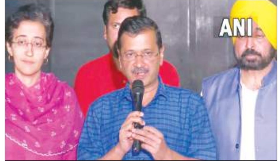
दिल्ली के मुख्यमंत्री अरविंद केजरीवाल सीबीआई मुख्यालय से साढ़े 9 घंटे के बाद बाहर निकले। सीबीआई ने दिल्ली आबकारी नीति (2022-21) घोषणा मामले में पूछताछ की।

अतीक अहमद और अशरफ के प्रयागराज में हुई हत्या के बाद अब कई तरह के सवाल भी उठ रहे हैं। सबसे बड़ा सवाल तो यही उठ रहा है कि इतने दुर्लभ अपराधी को पुलिस जब अपनी सुरक्षा धरे में अस्पताल लेकर जा रही थी तो क्या उसका सुरक्षा चक्र न के बराबर था। जब अतीक अहमद का नेटवर्क खुद पुलिस ने पाकिस्तान और आइएसआई से जोड़कर देखा रही थी तो इतने दुर्लभ अपराधी की सुरक्षा के लिए क्या अन्य सुरक्षा एजेंसियों के जवानों-कमांडों को नहीं लगाया जाना चाहिए था।